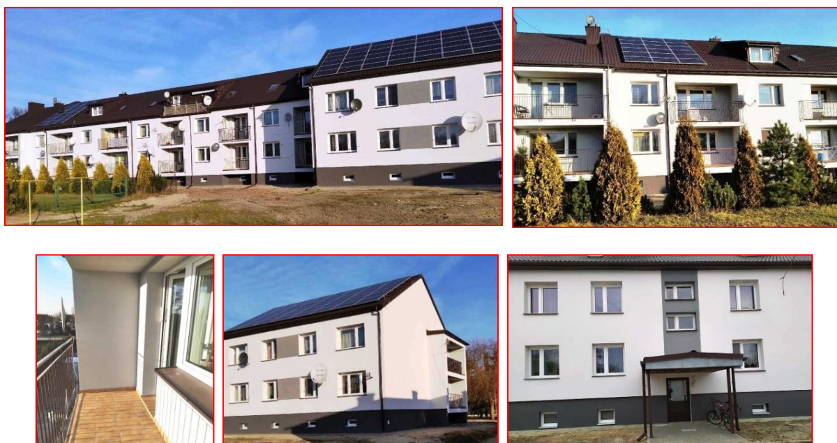
Rys. 5. Budynki po modernizacji.

oraz powietrzem z otoczenia (zazwyczaj zimniejszym). Układy te mogą ograniczać straty ciepła nawet o ok. 90%. Układy te powinny też umożliwiać utrzymanie właściwej wilgotności w pomieszczeniu.