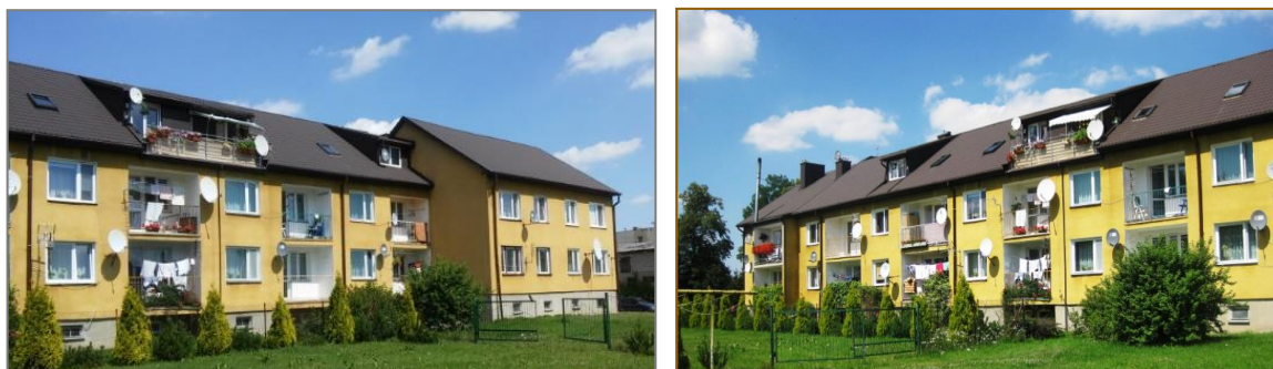
Rys.1. Ogólny widok domów przed modernizacją.

Termomodernizacja dotyczyła ocieplenia ścian i stropów, wymiany okien i drzwi oraz wymiana izolacji przeciw wilgotnościowej ścian piwnic. Osiągnięte współczynniki przenikania ciepła przedstawiono w Tabeli 1.