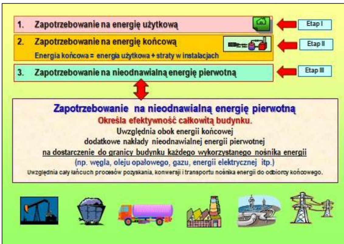
Rys. 1 Podstawowe etapy określania charakterystyki energetycznej